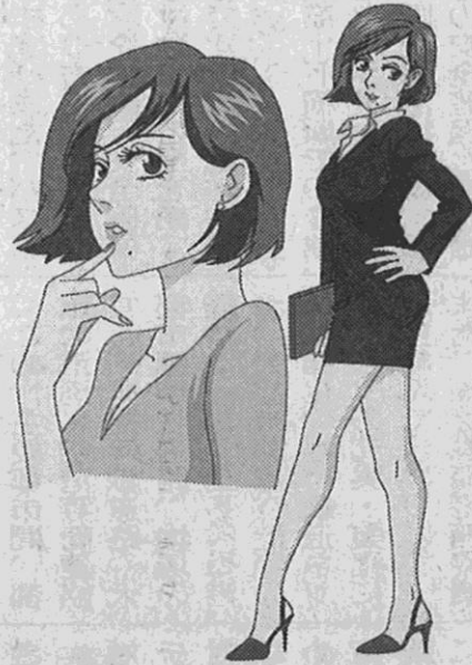
ポロケーションの プロフェッショナルな グラマラスな 霧ケ峰さんの