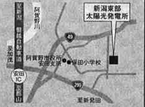
新潟東部太陽光発電所 新潟東部産業団地内